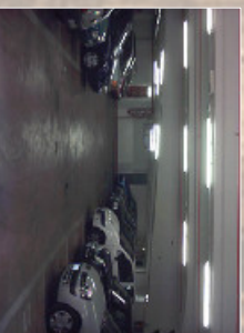
Progetti CPI per autorimessa sita a piano interrato