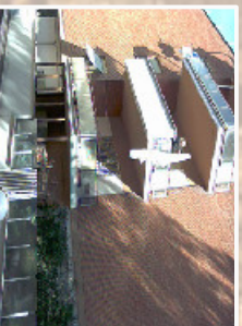
Manutenzione ordinaria del prospetto e trattamento delle superfici in cortina