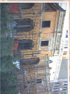
Ristrutturazione e ridistribuzione ambienti interni