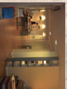
Progettazione di interni